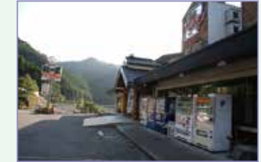
●ドライブイン龍の里

休憩、食事、お土産の購入に便利、ロケーションもよいドライブイン。ゆず加工品が人気