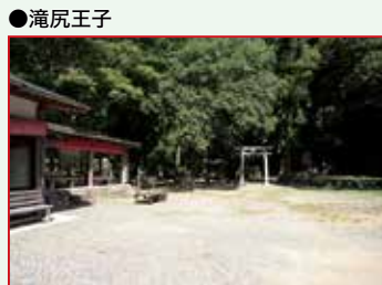
●滝尻王子 熊野三山への入口にある神社で正式には滝尻王子宮十郷神社という