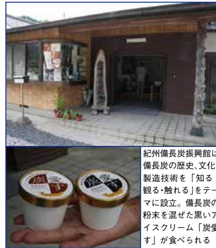
紀州備長炭振興館は備長炭の歴史、文化、製造技術を「知る・観る・触れる」をテーマに設立。備長炭の粉末を混ぜた黒いアイスクリーム「炭愛ず」が食べられる