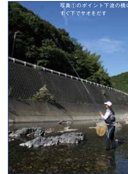
写真①のポイント下流の橋のすぐ下でサオをだす