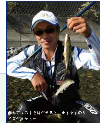
群れアユの中を泳がせると、まずまずのサイズが掛かった

切目川は三里ヶ峰付近を水源とし紀伊水道へと注ぐ幹川流路延長35kmの二級河川。友釣り河川としてはほとんど知られていないが、この川に足繫く通うファンがいるのも紛れもない事実。魅力は何といっても釣り人が少なく、いつでもどこでも、のんびりと友釣りを楽しめることだろう。