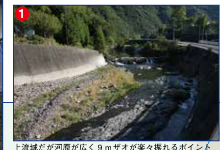
上流域だが河原が広く9mザオが楽々振れるポイント